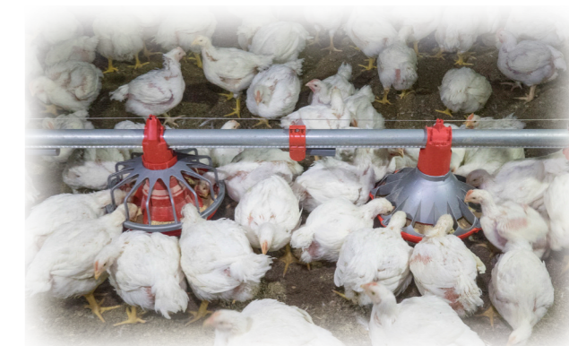
39 dias de idade