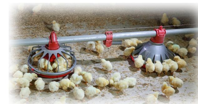
Três dias de idade