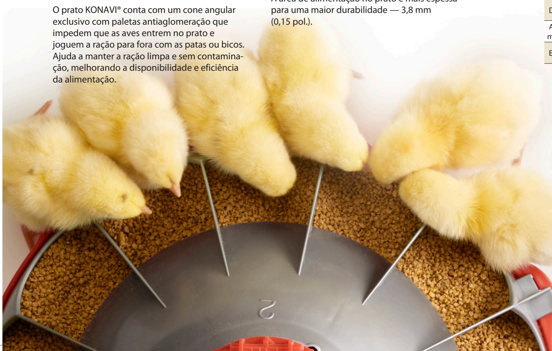
11 dias de idade

Aves adolescentes podem entrar nos comedouros com grelhas. Isso bloqueia o acesso ao alimento das outras aves e o contamina com fezes.