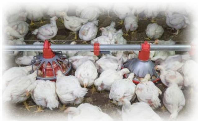
39 dias de idade