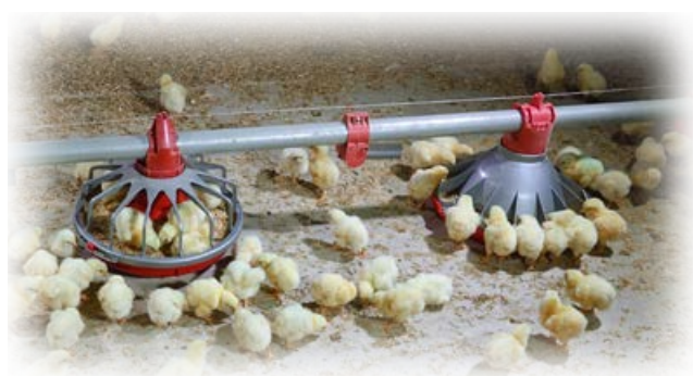
Três dias de idade