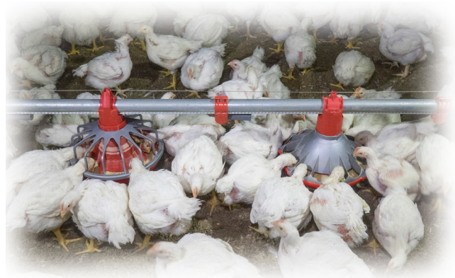
39 dagen oud

Opgroeïende kuikens kunnen nog altijd in voerpannen met een grill klimmen. Hiermee blokkeren ze voor andere kuikens de toegang tot het voer en verontreinigen ze het voer met hun uitwerpselen.