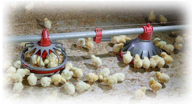
Drie dagen oud