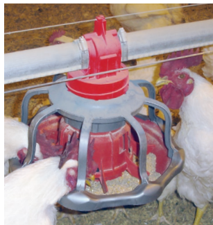
De REVOLUTION®-voerinstallatie van Chore-Time voor hanen