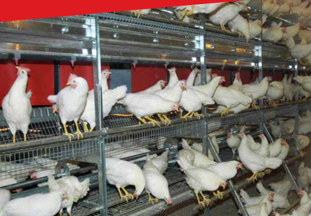
Volières Chore-Time 105 oiseaux /m de section