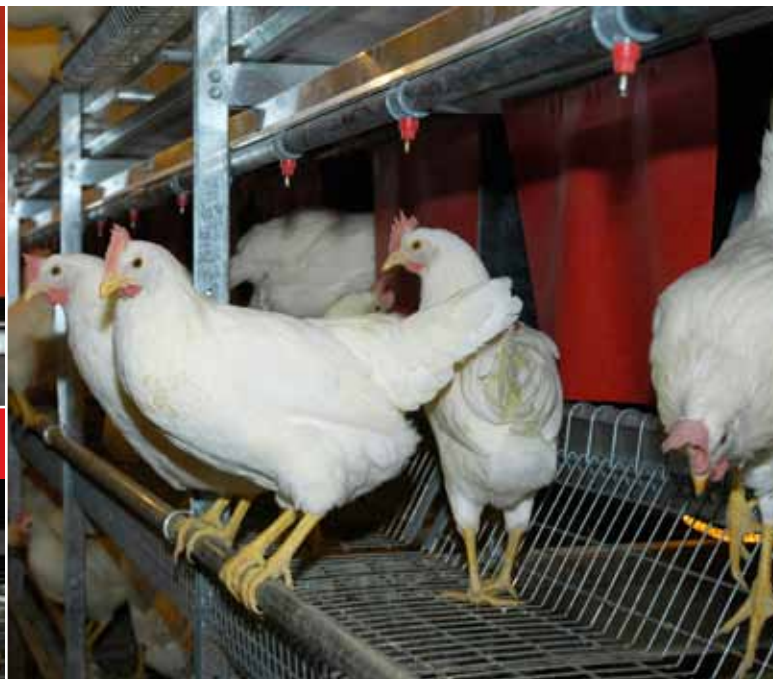
Volières Chore-Time pour Pondeuses