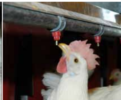
Abreuvoirs Chore-Time fiables