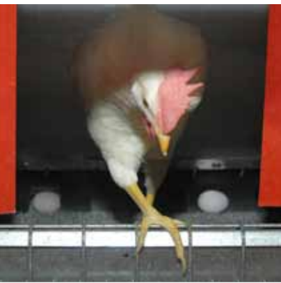
Support extra pour entrée / sortie pointe de ponte