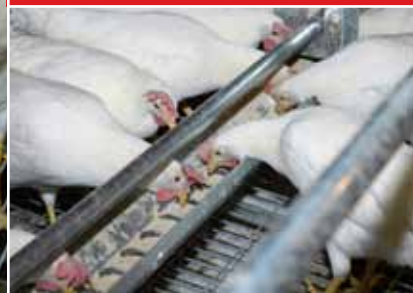
Mangeoire Chore-Time ULTRAFLO® Système connue et recommandée